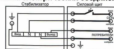
Схема электрических соединений серия «G»