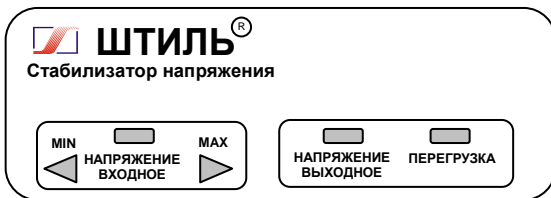
Рисунок 4.1 Передняя панель стабилизатора

На одной боковой стенке стабилизатора расположена розетка с заземляющим контактом для подключения нагрузки, а на другой – автоматический предохранитель 2А (у стабилизатора R250T) или 5А (у стабилизаторов R400T, R600T), или 10А (у стабилизатора R800T), выключатель СЕТЬ и выведен сетевой шнур для подключения стабилизатора к сети.