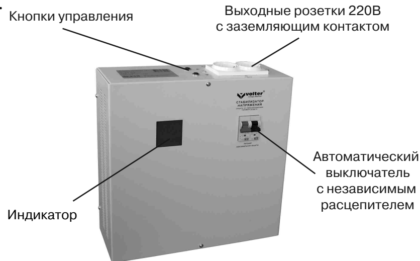
Рис.1. Стабилизатор (вид спереди)

Стабилизатор (рис.1) выполнен в металлическом корпусе прямоугольной формы, который позволяет эксплуатировать его как в настенном, так и в настольном варианте. Все функциональные узлы стабилизатора расположены на задней части корпуса и закрыты лицевой частью.